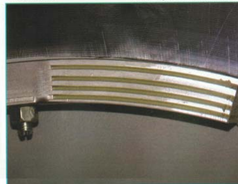
Abb.3: Radschallabsorber am Güterwagenrad der Bochumer Verein Verkehrstechnik GmbH.

So werden mit strukturoptimierten Rädern und Radschallabsorbern die Schallemissionen von Radscheiben deutlich verringert. Dies ist besonders für Güterwagen relevant, da deren