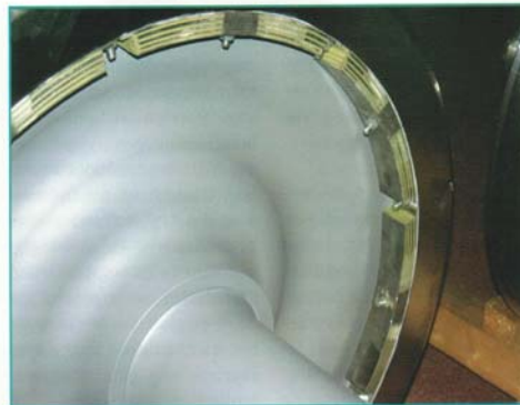
Abb.2: Radschallabsorber am Güterwagenrad der Bochumer Verein Verkehrstechnik GmbH.

Bis zum Jahre 2020 soll damit ein Beitrag zur Reduzierung des Schienenverkehrslärms um 50