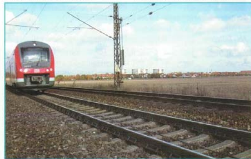
Abb.5: Schienenstegdämpfer der Firma Vossloh.

sen sich am Markt durchsetzen und behaupten. Doch dieser Prozess ist nicht von heute auf morgen zu bewältigen.